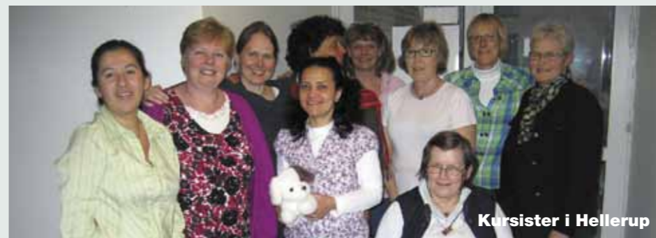
Kursister i Hellerup