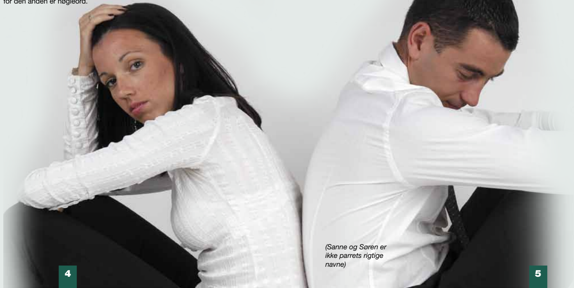
(Sanne og Søren er ikke parrets rigtige navne)

Søren har ofte været frustreret og haft svært ved at holde det ud. For nylig kom han med i en mandegruppe i KRIS regi, hvor de er fire mænd, som alle er gift med seksuelt misbrugte kvinder. Han er glad for at komme i gruppen, for de ved, hvad han snakker om. De kender fx frustrationen fra sig selv, og det giver basis for gode snakke om liv og parforhold, og om hvor vigtigt det er at kæmpe for sin hustru.