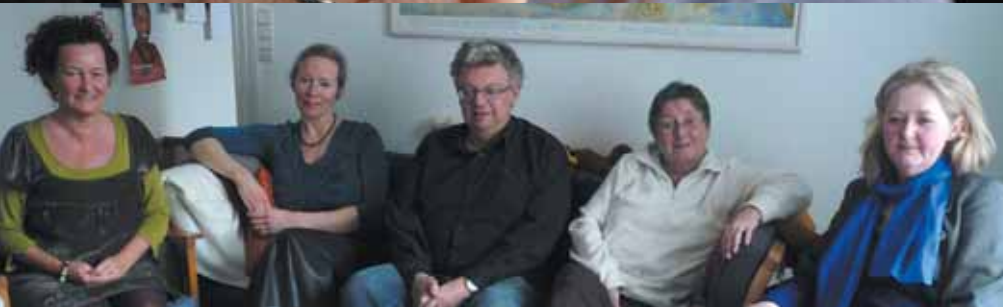
Medarbejdere fra Århus samlet til møde.