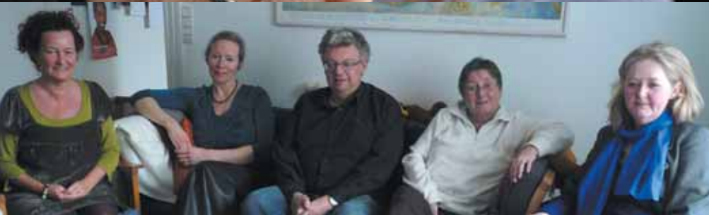
Medarbejdere fra Århus samlet til møde.